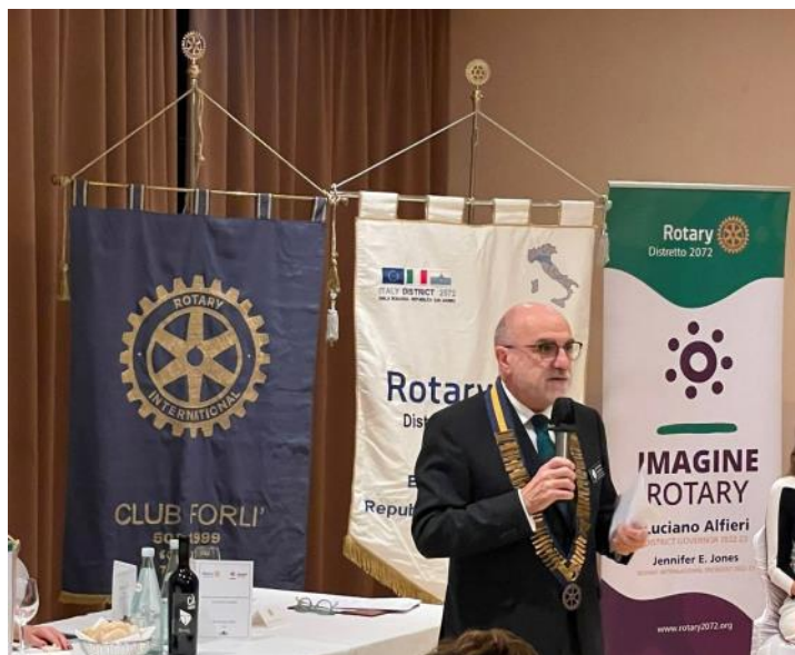
Il Governatore del Distretto 2072, Luciano Alfieri

Per un Club Rotary la visita del Governatore è il momento istituzionale più importante nell'annata rotariana, è il momento nel quale il Governatore verifica lo stato di salute del Club, si aggiorna sui programmi, le attività e, soprattutto, sui service.