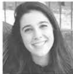
PREFETTO Cecilia Ranieri